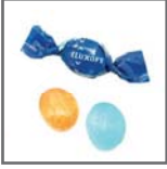
caramelos 2 lazos mini