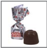
bombón 1 lazo