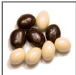
cacahuets con chocolate