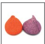
top mallow (solo en tamaño grande)