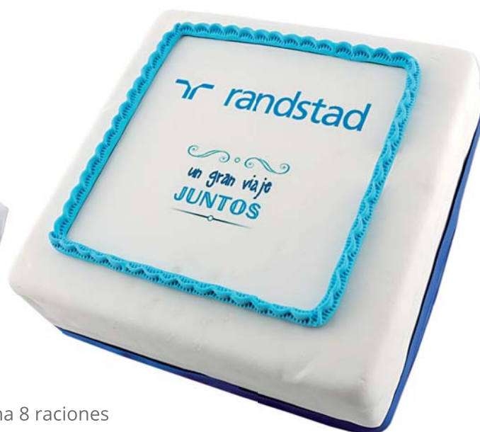
Tarta Artesana 8 raciones