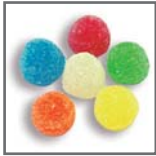
perlas de goma