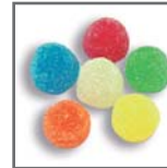
perlas de goma