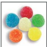
perlas de goma